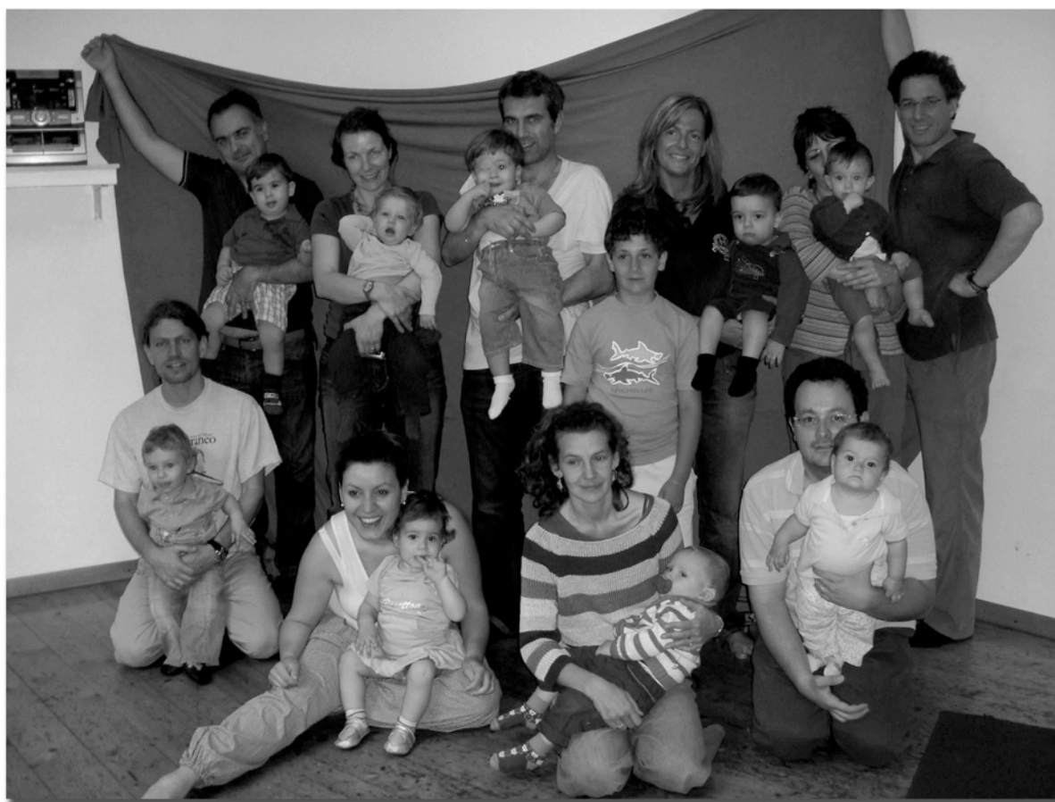
La classe di Musica in Culla 1 della Scuola Donna Olimpia nell'anno musicale 2008/2009